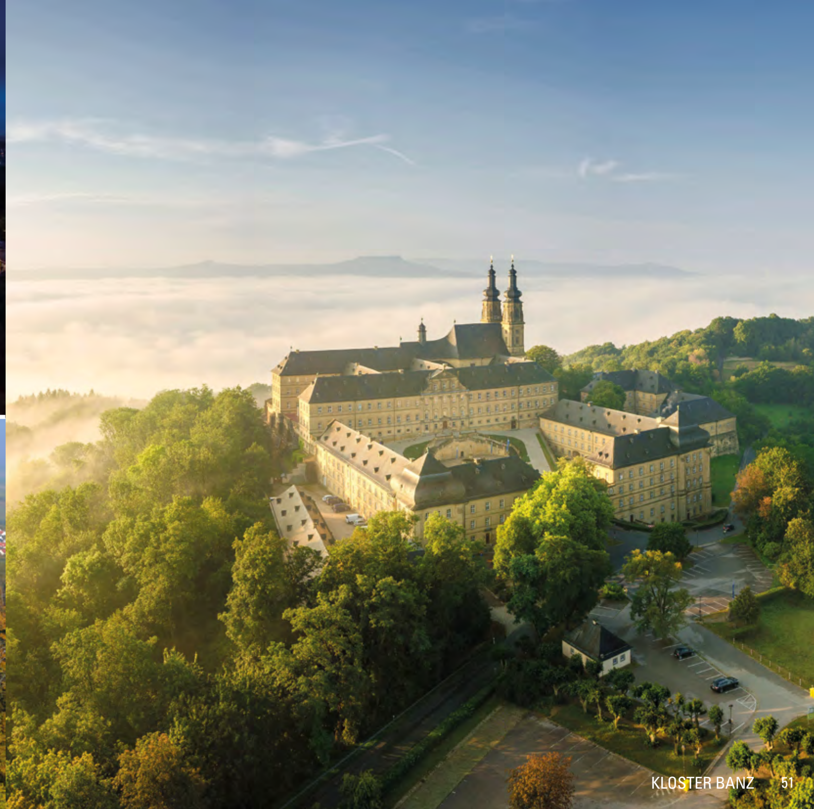
KLOSTER BANZ 51